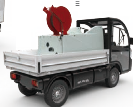
Arrosage Nettoyeur haute pression