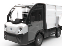
Benne de collecte corbeilles

CONFIGURATIONS MIXTES Nettoyer, aspirer, ranger : 100 % flexibilité