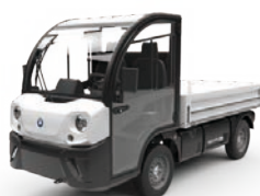
Plateau fixe ou basculant